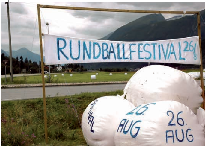
Rundballefestivalen finner sted i august hvert fjerde år.

1-2-3: Til tonene fra Svanesjøen stabler traktorene rundballene opp på hverandre. Stive traktorledd til tross, dansen er rett og slett nydelig.