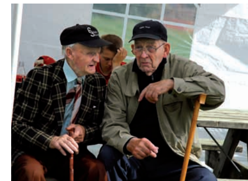
Gamlekarene glemte å spytte ut snusen da de ble vitne til traktorballett med rundballer.

I 2004 viste naturen muskler da enorme stein- og gjørmemasser la seg som et seigt teppe over en gård i Supphelledalen. Husene ble berget – så vidt. Fordi rundballene til bonden la seg som et dike foran dem.